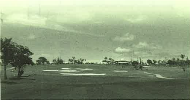
スターツ グラム ゴルフリゾート スターツ グラム リゾートホテル